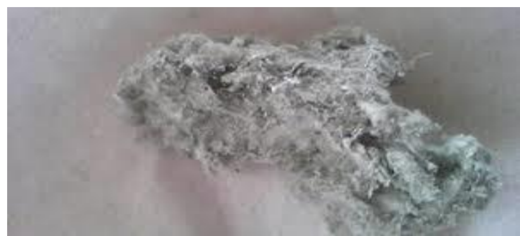
アスベスト吹付け材 (ロックウール吹付け材)