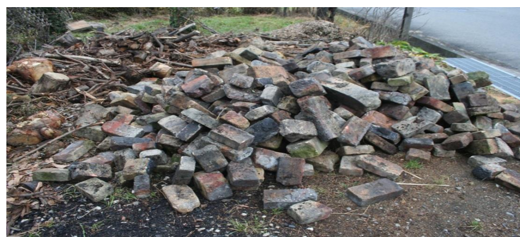
耐火レンガはダイオキシン分析必須 有害物質付着の恐れ有り