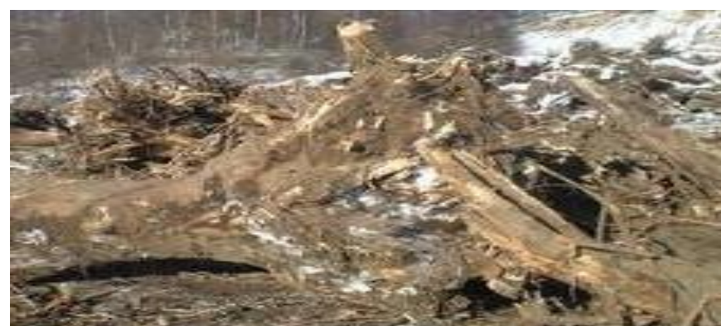
汚染土が付着している恐れもあります 泥・土等は落としてください