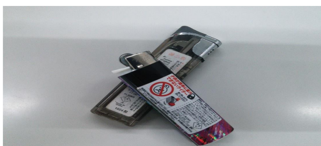
マッチ・ライター等 火災の原因となります