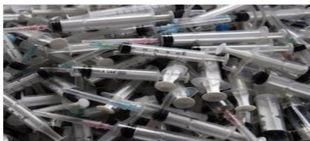
注射器・点滴容器等(未使用も含む)