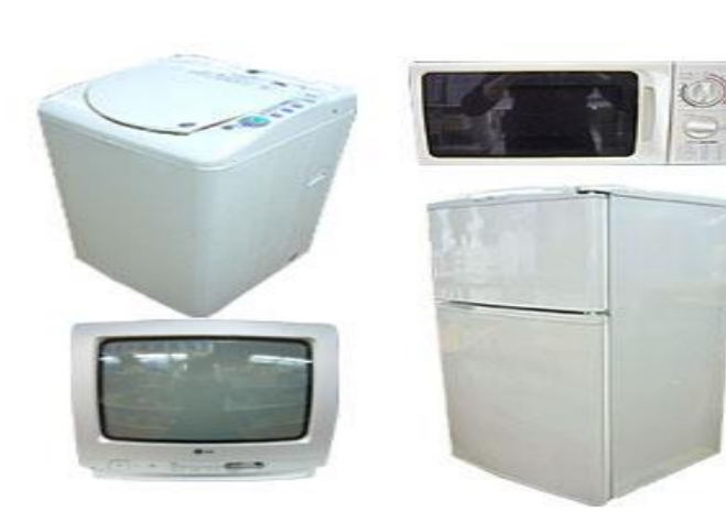
家電リサイクル法対象 テレビ・洗濯(乾燥)機・冷蔵(冷凍)庫・エアコン