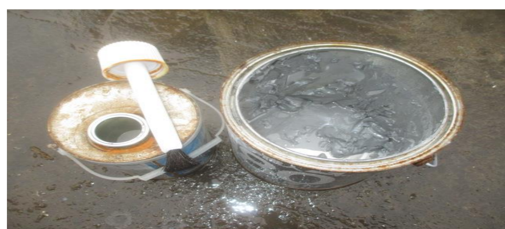
液体・液状のものは受入不可 固形化塗料は廃プラスチックとして受入可