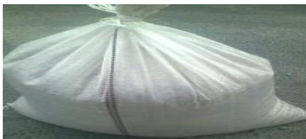
極力、中身が確認できる状態での 搬入をお願いします