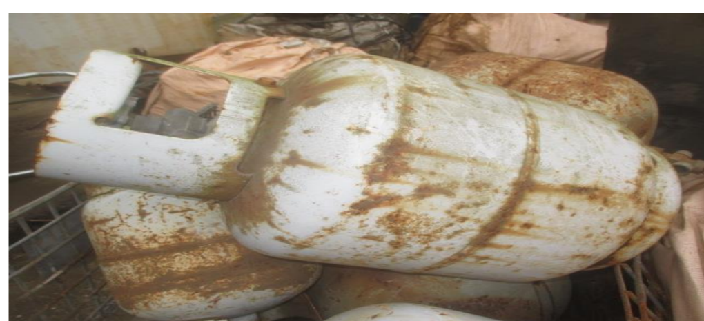
スプレー缶・ガスボンベ・消火器等 切断又は複数穿孔済みは受入可