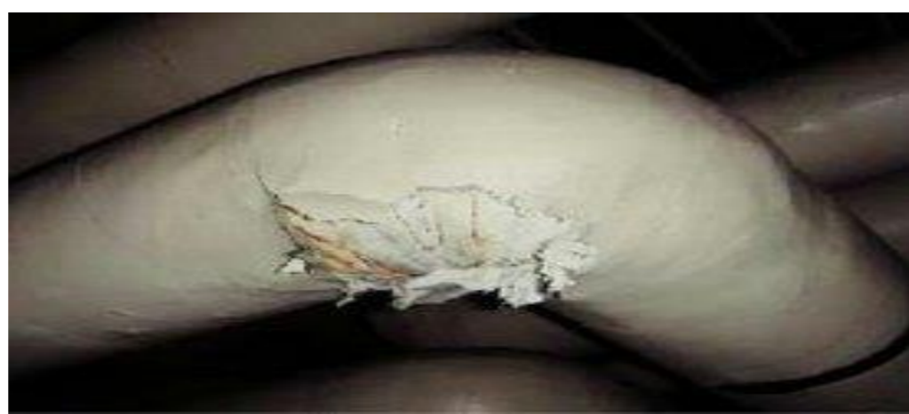
ボイラー配管保温材 (エルボ配管等)