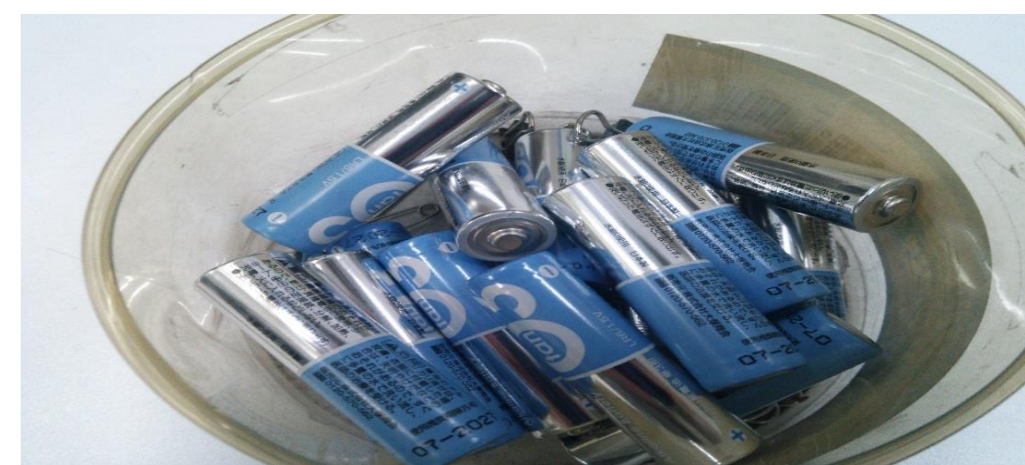
乾電池は中身が汚泥に該当 許可品目外はお受入できません

※大きさ、形状、状態によって受入不可、または、追加料金が発生する場合がございます ※当中間処理場の検収(展開検査)により廃棄物検収内容が変更になる場合がございます