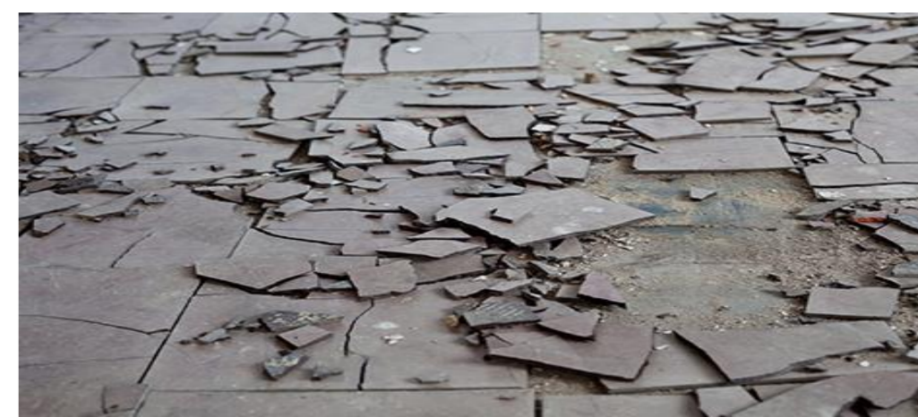
ビニルタイル (Pタイル等)