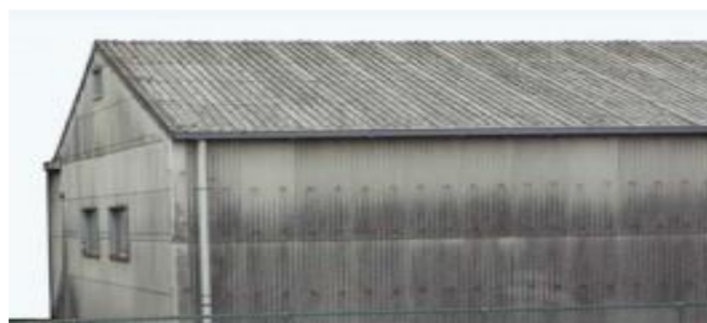
スレート建材 (波型のものや板状のもの)