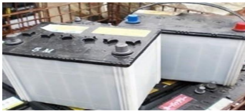
中身の電極が特別管理廃棄物に該当